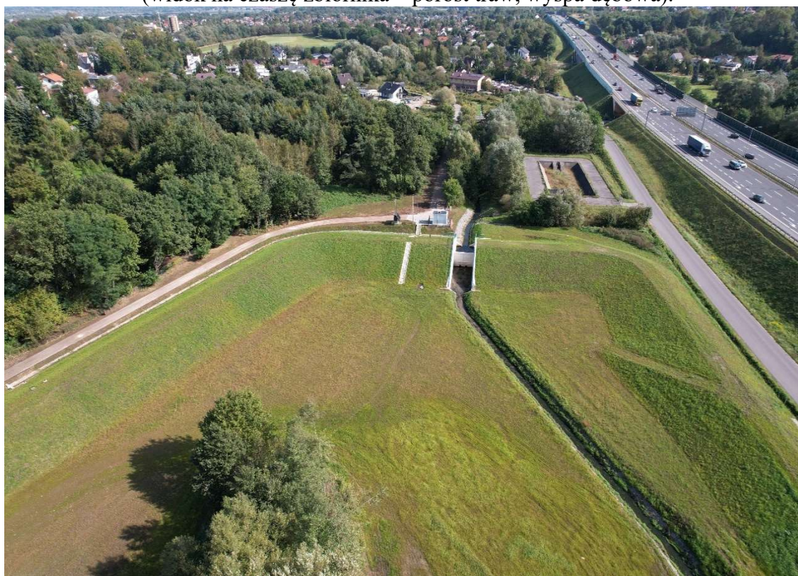
Foto. 12. Zbiornik Malinówka I , trzecia dekada września 2023 r. (zakończone prace).