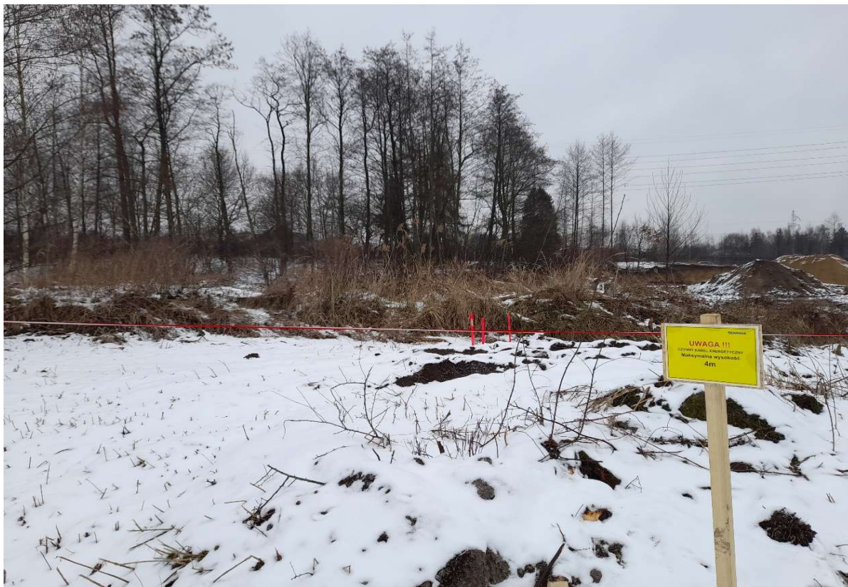
Foto. 15. Zbiornik Malinówka 2 , trzecia dekada stycznia 2022 r. (oznaczenie strefy pod linią elektroenergetyczną, w tle wygradzenia).