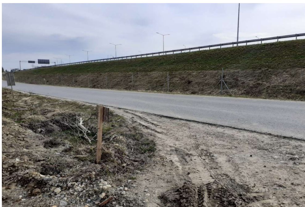
Foto. 10. Zbiornik Malinówka 1 , druga dekada marca 2023 r. (stan dróg publicznych – utrzymywanie czystości).