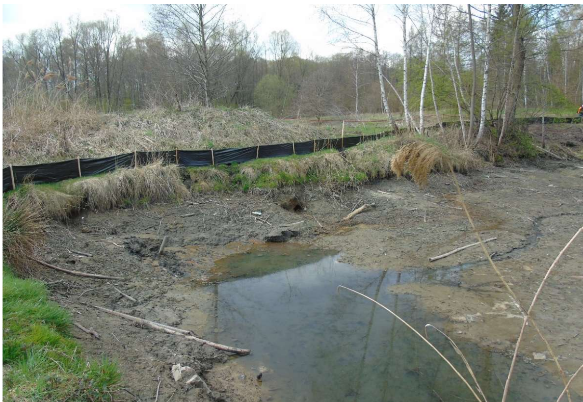
Foto. 17. Zbiornik Malinówka 2 , trzecia dekada kwietnia 2022 r. (płotki herpetologiczne wokół stawu)