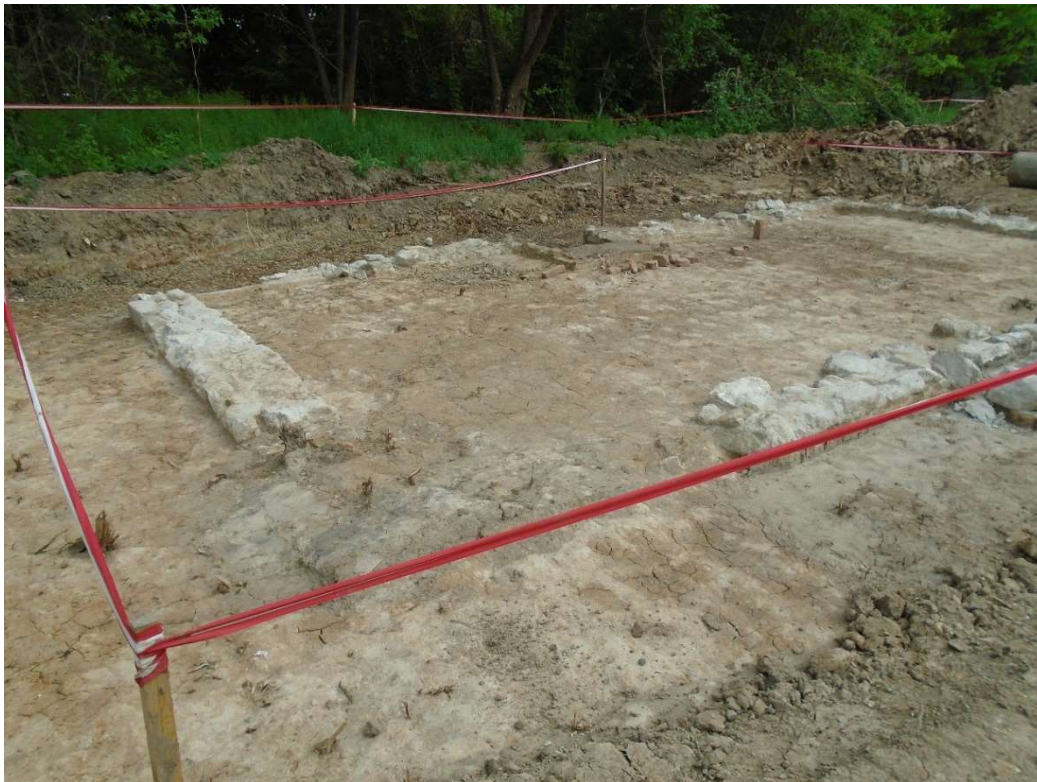
Foto. 7. Zbiornik Malinówka 1 , druga dekada maja 2022 r. (wygrodzone stanowisko archeologiczne po udokumentowaniu – zakończeniu prac archeologicznych).