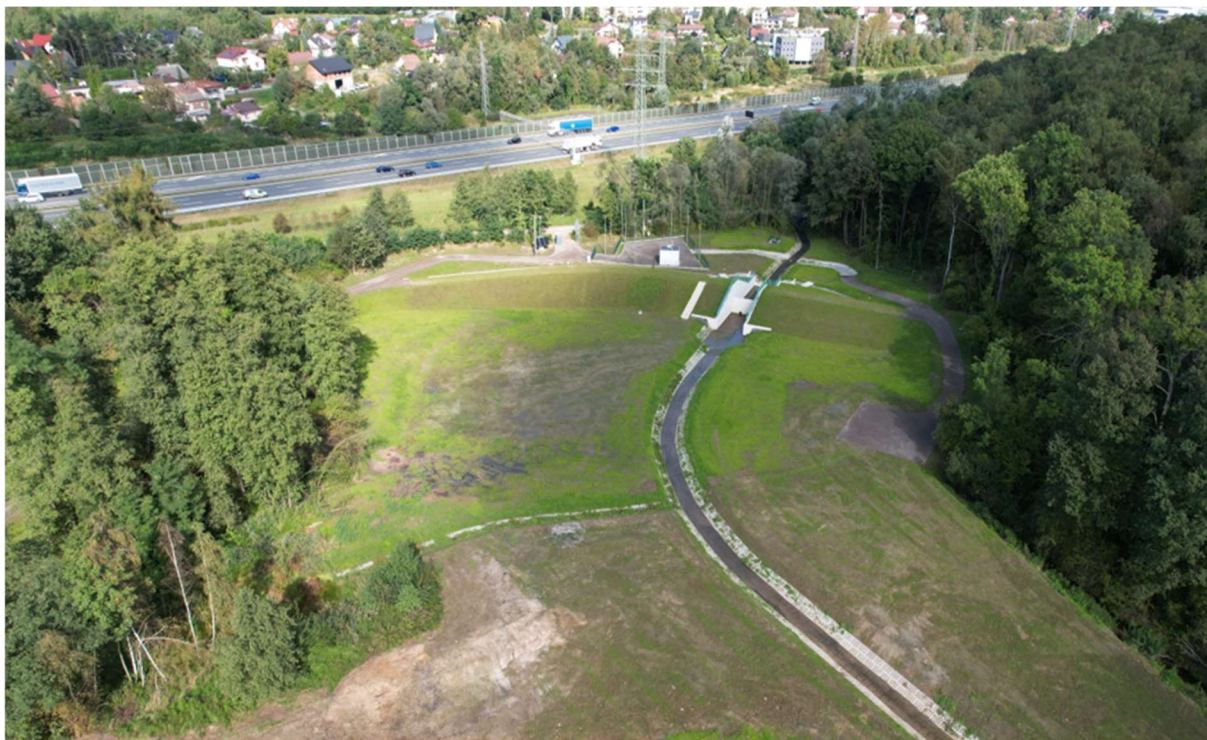
Foto. 21. Zbiornik Malinówka 2 , trzecia dekada września 2023 r. (urządzenie przelewowo-spustowe, czasza zbiornika – prace ukończone)