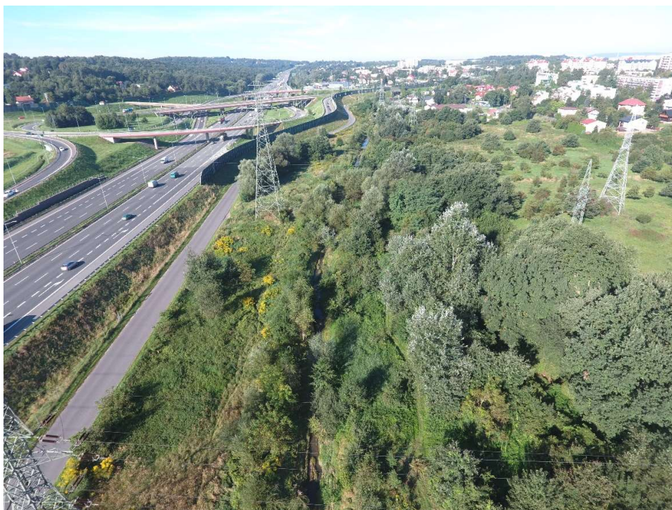
Foto. 1. Zbiornik Malinówka 1 , wrzesień 2021 r. (widok na teren planowanego zbiornika Malinówka 1 przed rozpoczęciem robót).