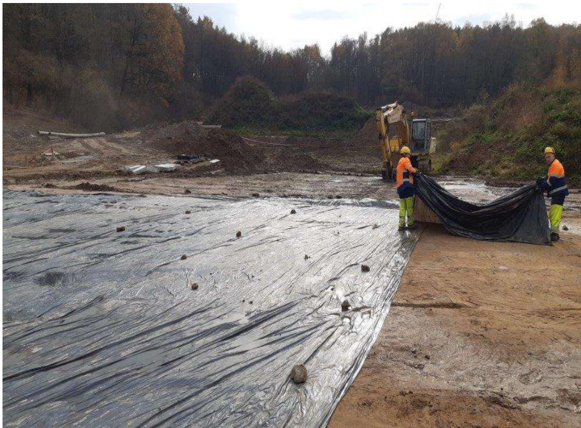
Foto. 19. Zbiornik Malinówka 2 , pierwsza dekada listopada 2022 r. (prace w czaszy zbiornika)