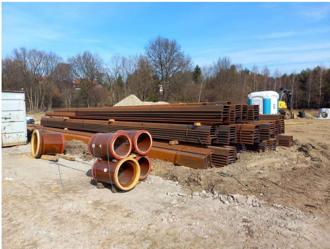
Foto. 5. Zbiornik Malinówka I , druga dekada marca 2022 r. (miejsce składowania materiałów, dostęp do urządzeń sanitarnych).