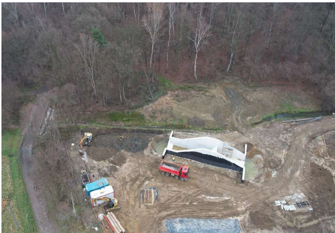
Foto. 20. Zbiornik Malinówka 2 , trzecia dekada grudnia 2022 r. (urządzenie przelewowo-spustowe, czasza zbiornika)