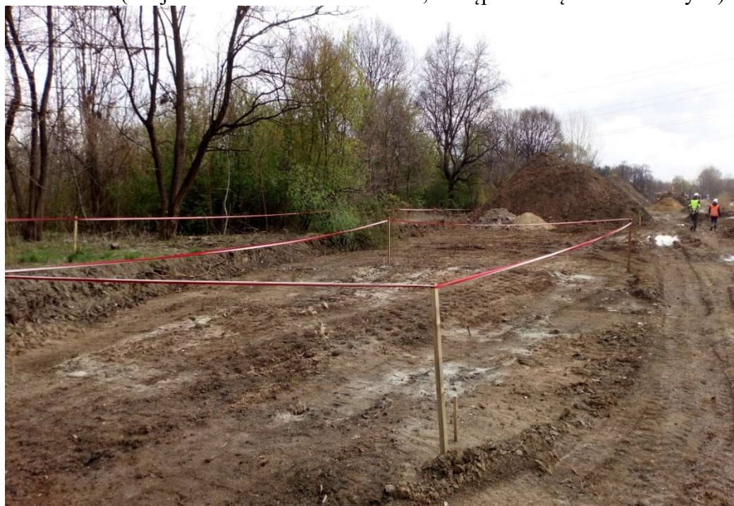
Foto. 6. Zbiornik Malinówka I , pierwsza dekada kwietnia 2022 r. (wygrodzone miejsce znaleziska archeologicznego, w tle wygrodzenia drzew).