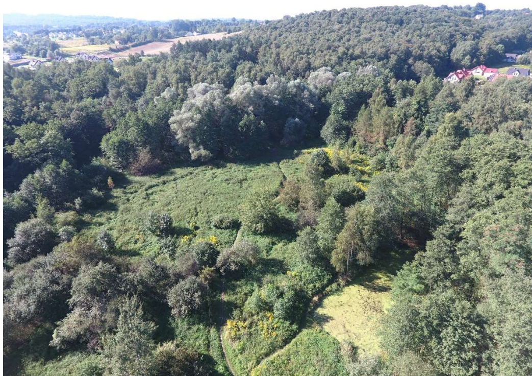
Foto. 14. Zbiornik Malinówka 2 , wrzesień 2021 r. (widok na teren planowanego zbiornika Malinówka 2 przed rozpoczęciem robót).