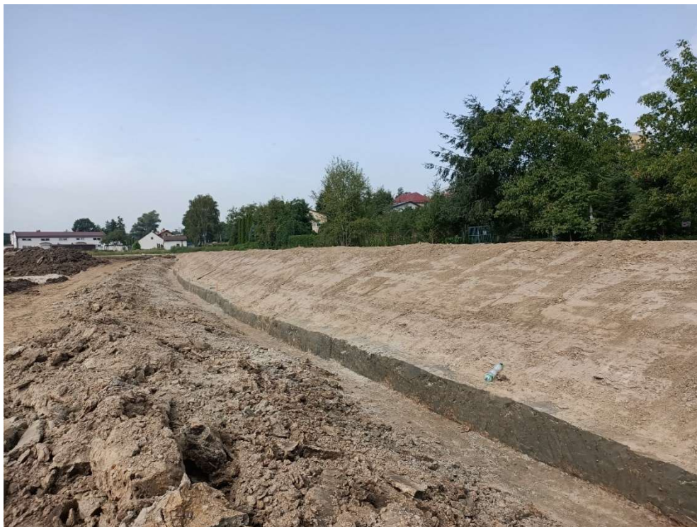
Foto. 9. Zbiornik Malinówka 1 , trzecia dekada sierpnia 2022 r. (formowanie nasypu – obwałowania zbiornika).