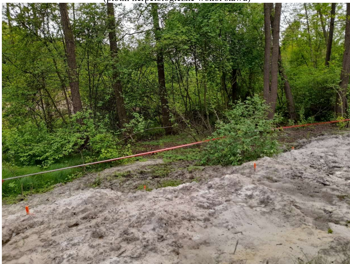
Foto. 18. Zbiornik Malinówka 2 , trzecia dekada maja 2022 r. (utrzymanie wygradzeń drzew wyłączonych z wycinki)