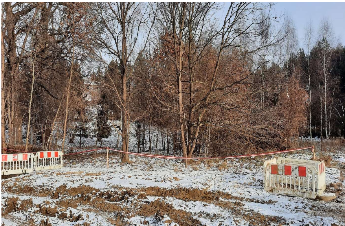
Foto. 3. Zbiornik Malinówka 1 , druga dekada grudnia 2021 r. (teren po wycince drzew, przebudowa kanalizacji).