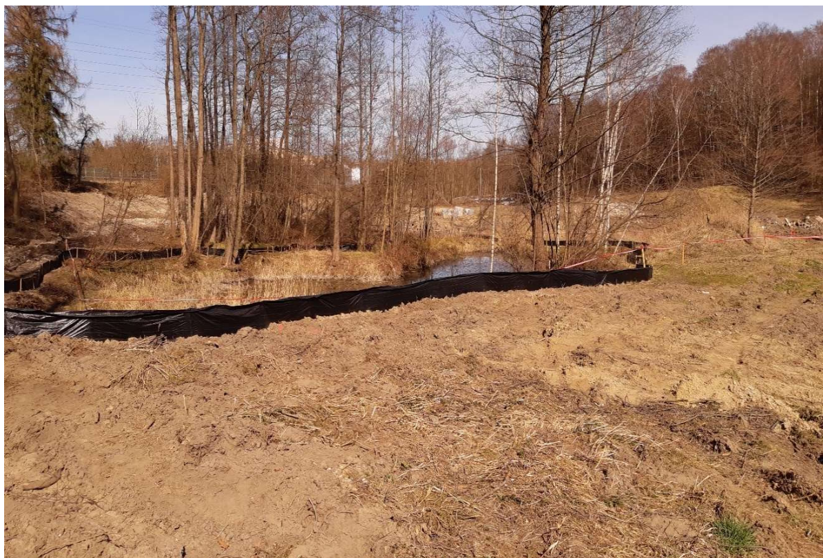
Foto. 16. Zbiornik Malinówka 2 , trzecia dekada marca 2022 r. (płotki herpetologiczne wokół stawu, obok wygradzenia terenu wyłączzonego z wycinki).