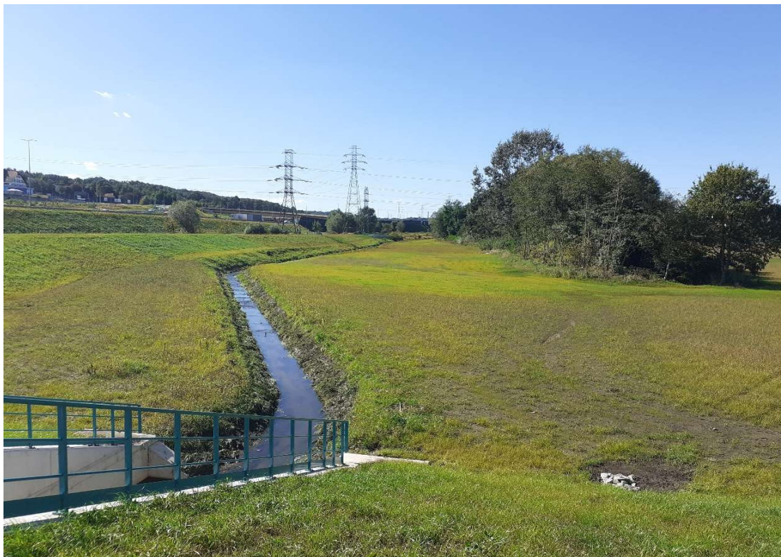
Foto. 11. Zbiornik Malinówka I , druga dekada września 2023 r. (widok na czaszę zbiornika – porost traw, wyspa dębowa).