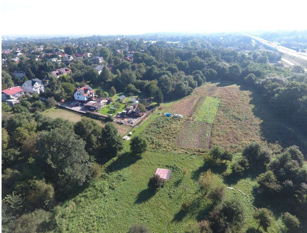
Foto. 2. Zbiornik Malinówka 1 , wrzesień 2021 r. (widok na teren planowanego zbiornika Malinówka 1).