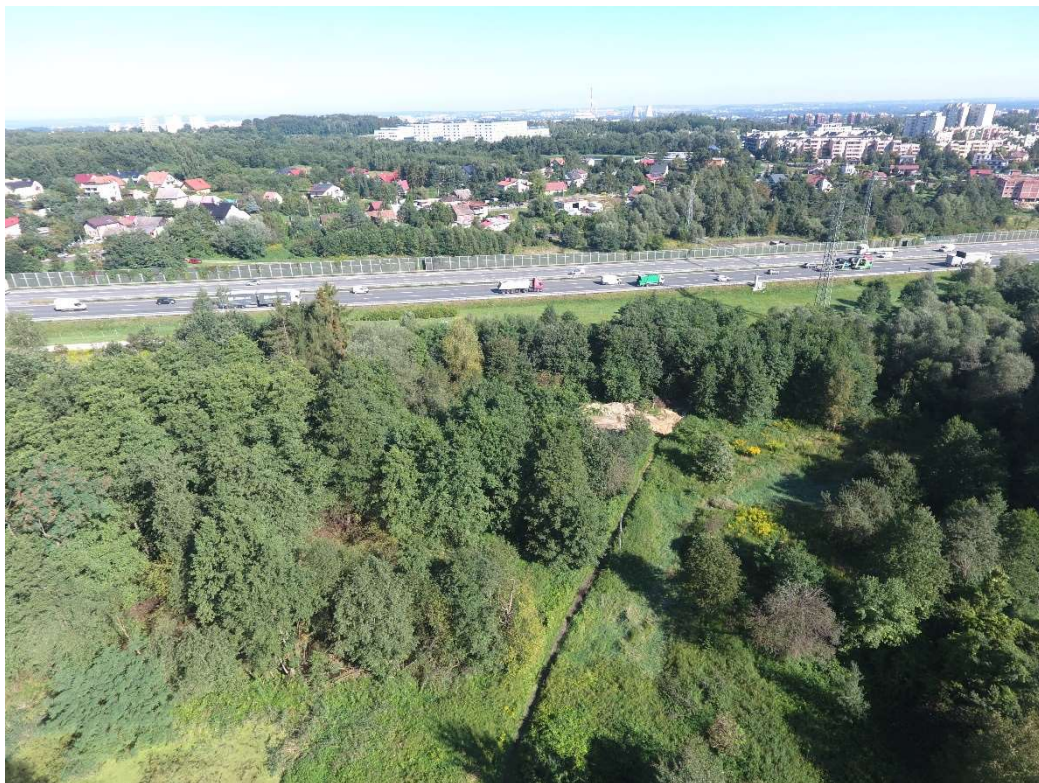
Foto. 13. Zbiornik Malinówka 2 , wrzesień 2021 r. (widok na teren planowanego zbiornika Malinówka 2 przed rozpoczęciem robót).