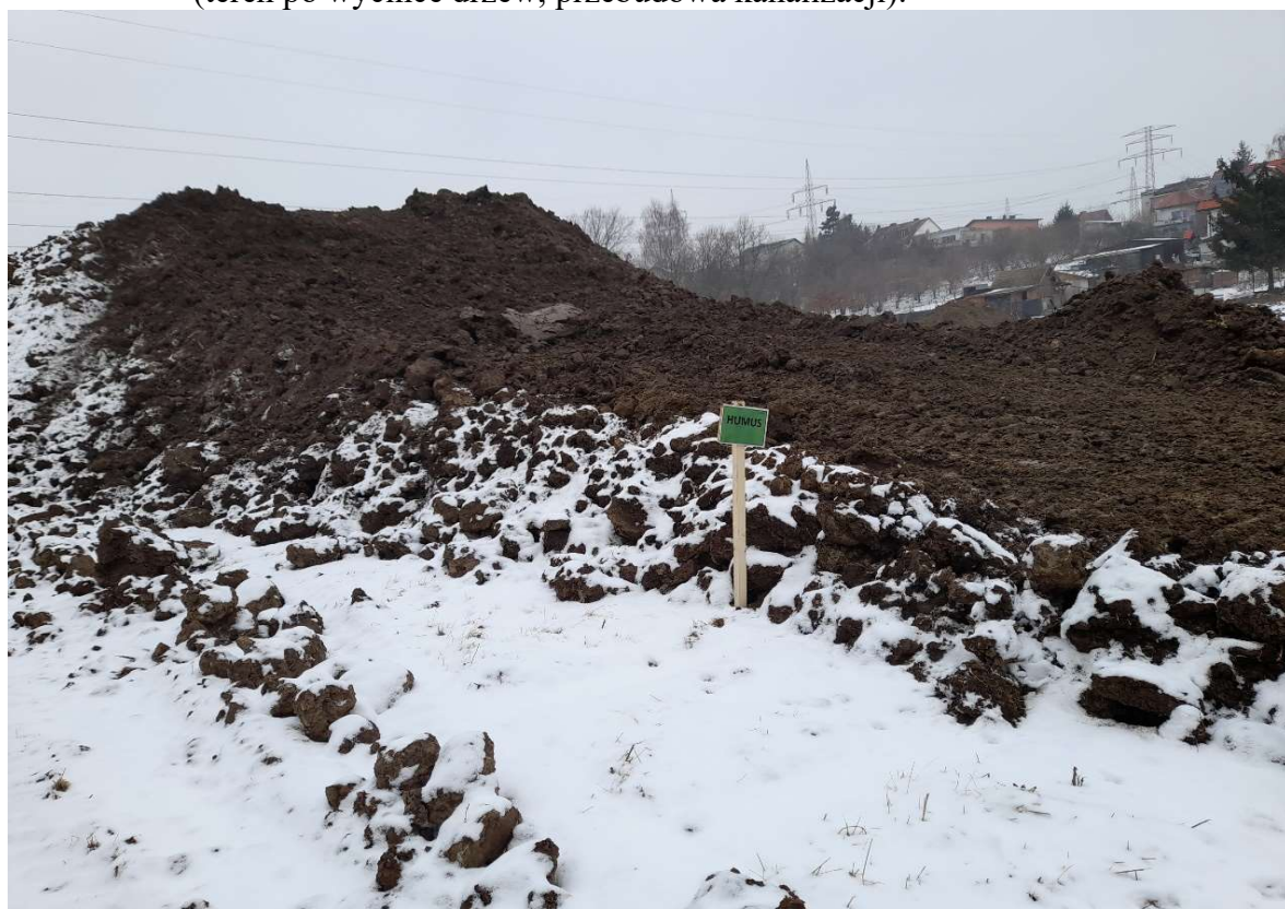
Foto. 4. Zbiornik Malinówka 1 , druga dekada stycznia 2022 r. (formowanie pryzmy humusu, oznakowanie pryzmy).